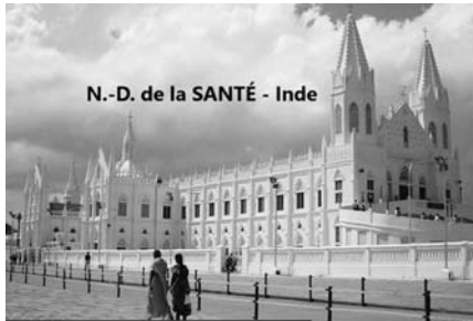
N.-D. de la SANTÉ - Inde