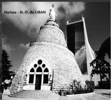
Harissa - N.-D. du LIBAN