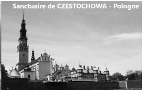
Sanctuaire de CZESTOCHOWA - Pologne