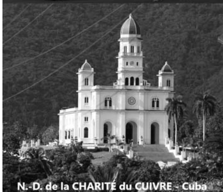
N.-D. de la CHARITÉ du CUIVRE - Cuba