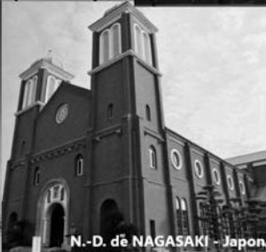
N.-D. de NAGASAKI - Japon