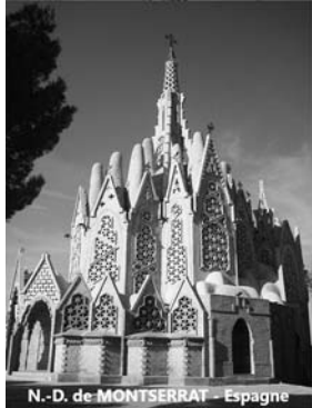
N.-D. de MONTSERRAT - Espagne