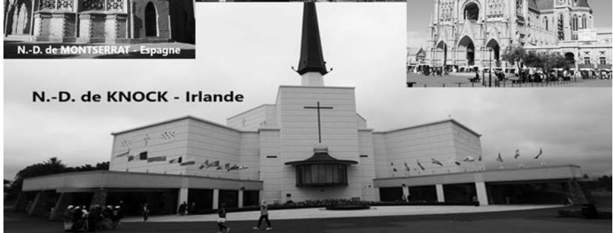
N.-D. de KNOCK - Irlande